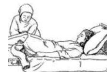
Смена нательного белья г способом

Смена нательного и постельного белья пациенту