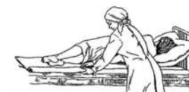
Смена постельного белья продольным с